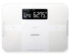
体重体組成計 HBF-255T-W (オムロン)