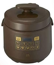
マルチ圧カクッカー BOE058-BR (ブルーノ)