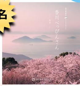
香川へびんさん カタログギフト 『べっぴんさん』(紫雲)