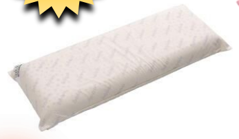
ボディドクター ドクターロングピロー 110 (グローバル産業)