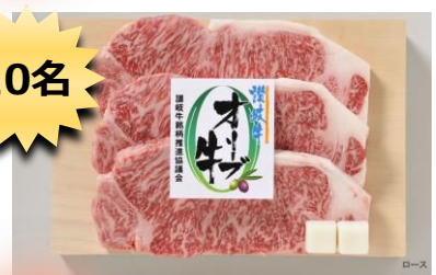
ロース オリーブ牛 (ロース)