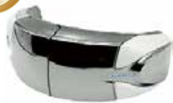
3DアイマジックS EM-03(WH) (ドクターエア)