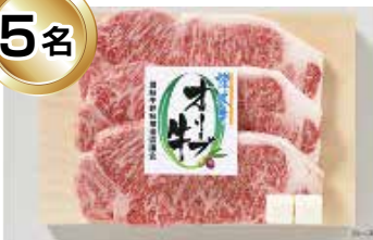
オリーブ牛 (ロース)