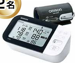
上腕式血圧計 HCR-7601T (オムロン)