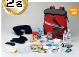
THE ISU PACKER 防災セット 3100