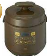
マルチ圧力炊飯器 BOE058-BR (ブルー)