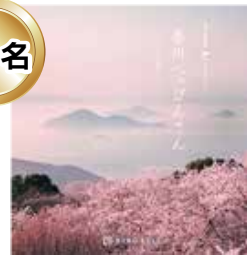
カタログギフト 『べっぴんさん』(紫雲)