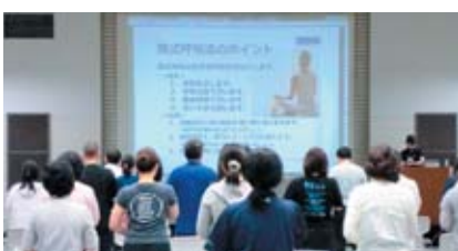
からだマネジメントセミナー

「からだマネジメントセミナー」を体験した後、ラテンの音楽を取り入れたダンスエクササイズ「ZUMBA」と、アロマの漂う中で「ヨガ」を行いました。