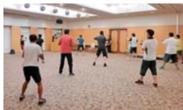
格闘技エクササイズ