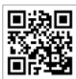
サポートページQRコード