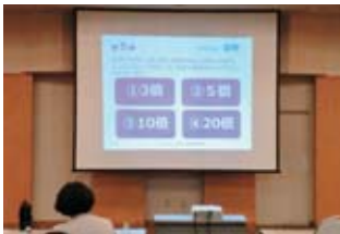
ダイエットセミナー