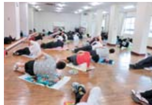
体幹バランストレーニング