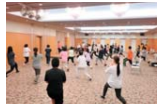
サーキットトレーニング