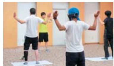
体幹バランストレーニング