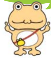
貸付キャラクター 「おたすケロ」

住宅の新築・増改築・購入のために、共済組合から貸付金を借り受けた時は、一定の要件に該当すると住宅借入金等特別控除を受けることができます。