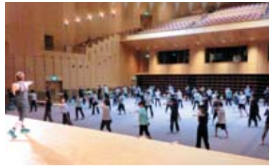
格闘技エクササイズ